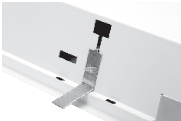
(w komplecie / included / im Satz / complet / в комплекте)